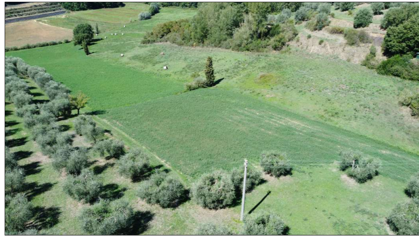
Ripresa fotografica 4