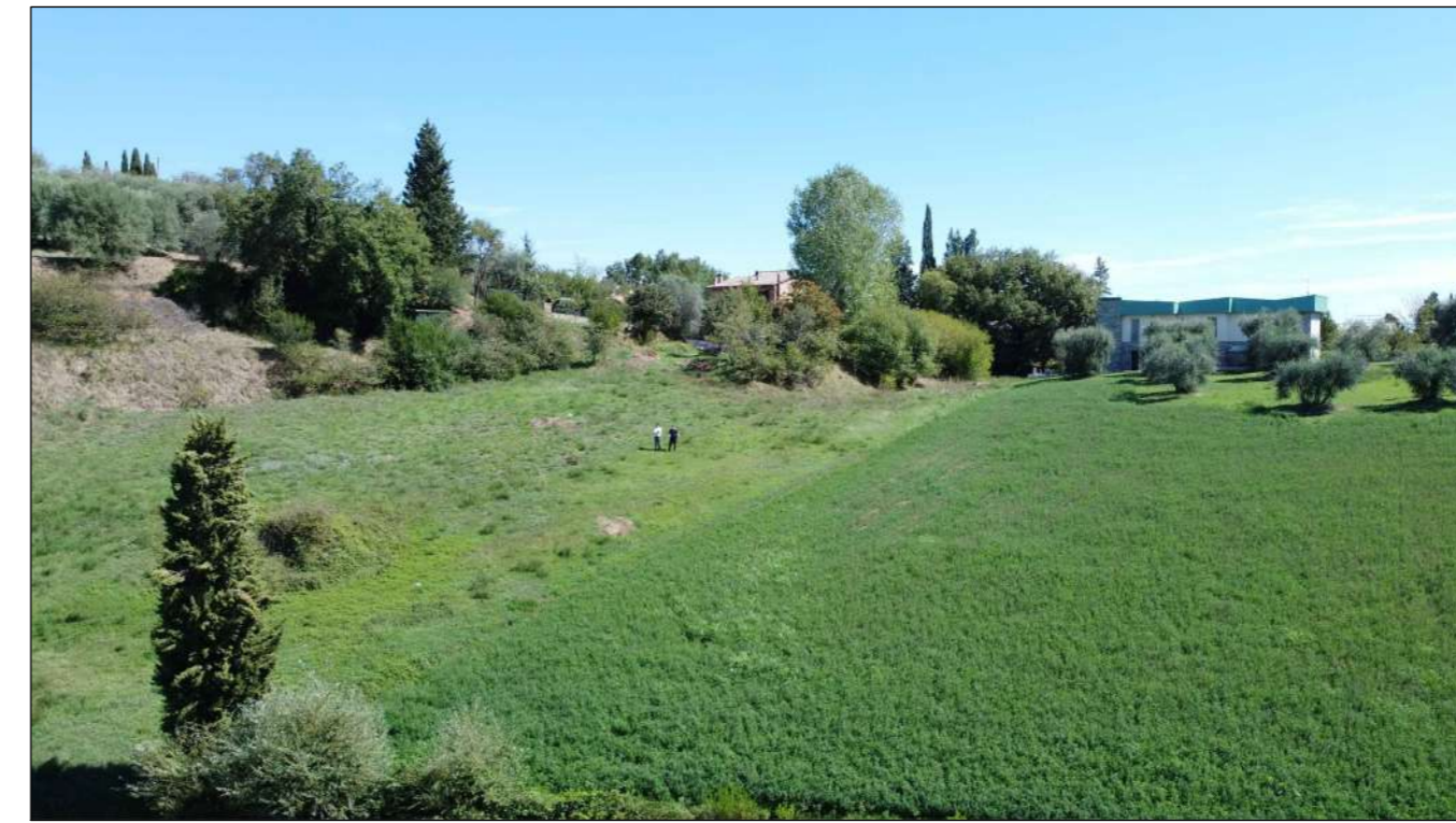
Ripresa fotografica 5