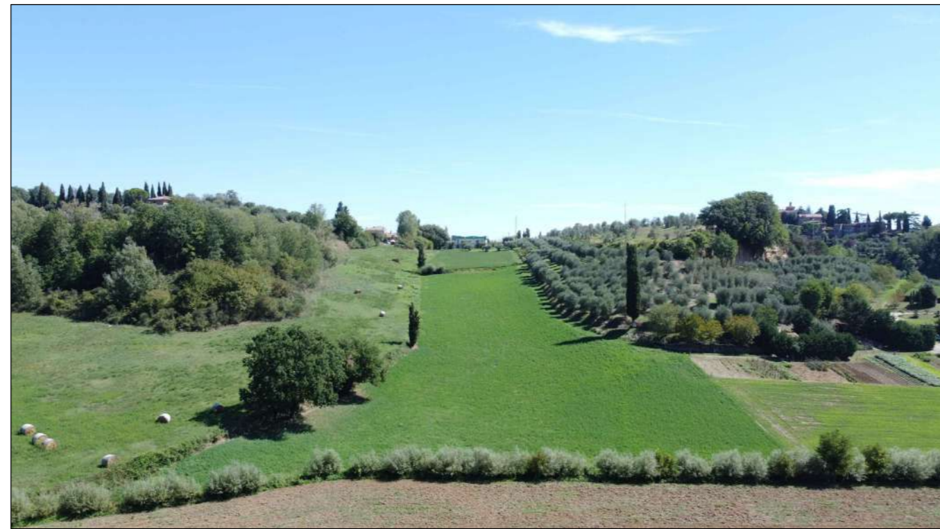
Ripresa fotografica 1