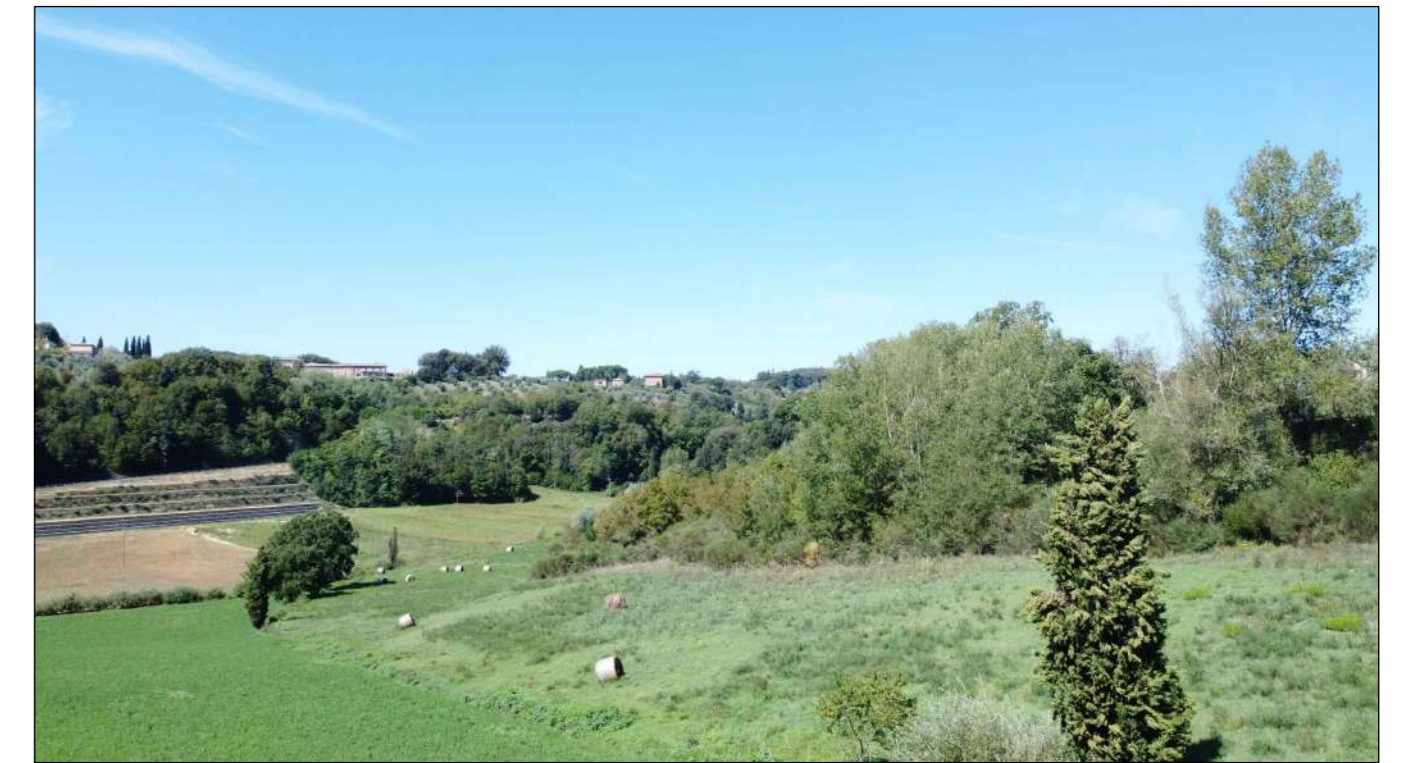
Ripresa fotografica 3