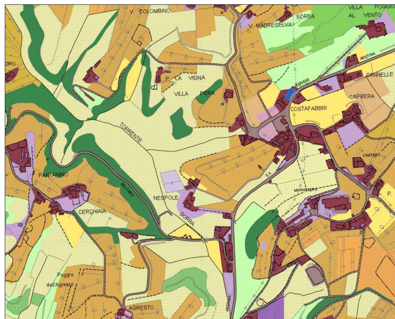
Uso del suolo