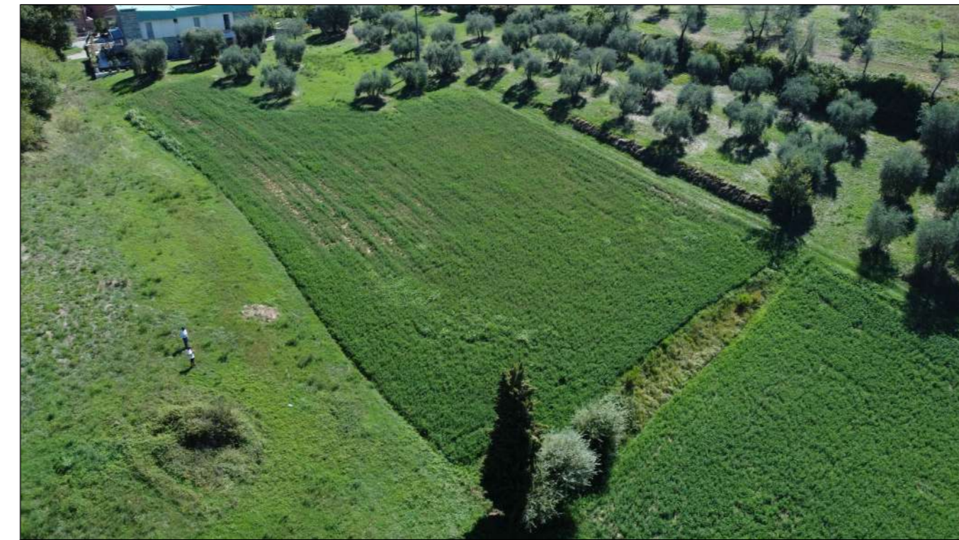
Ripresa fotografica 2