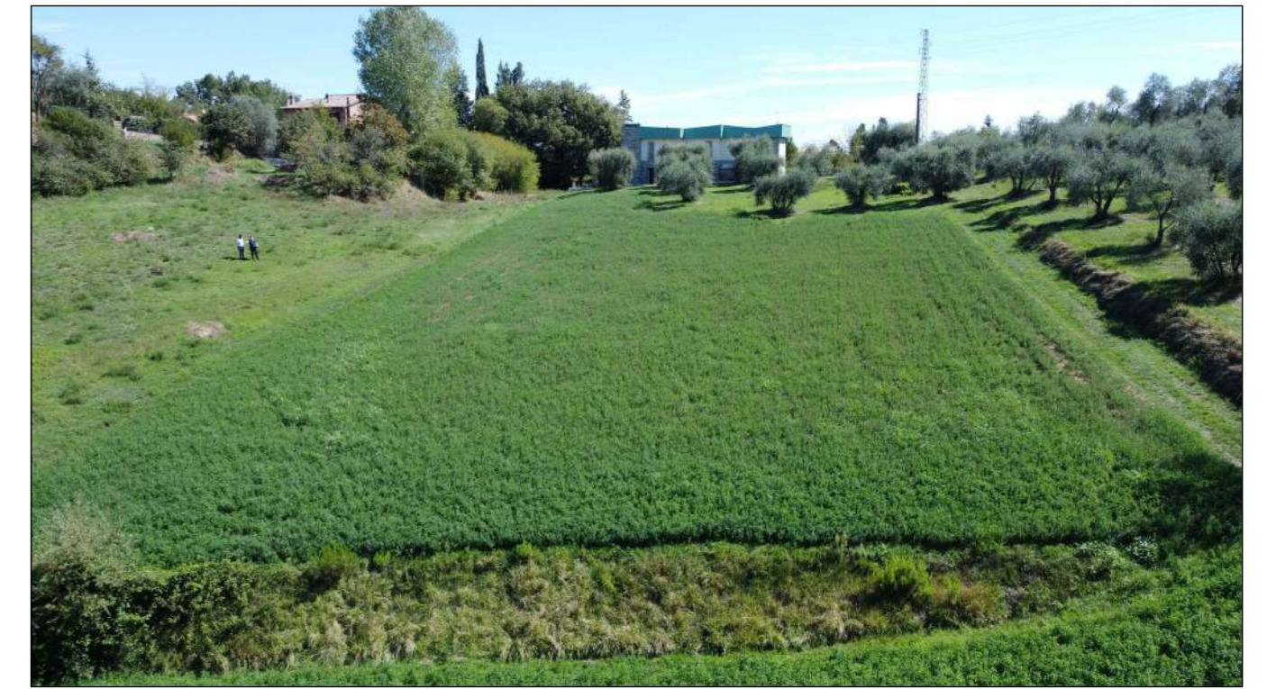
Ripresa fotografica 6