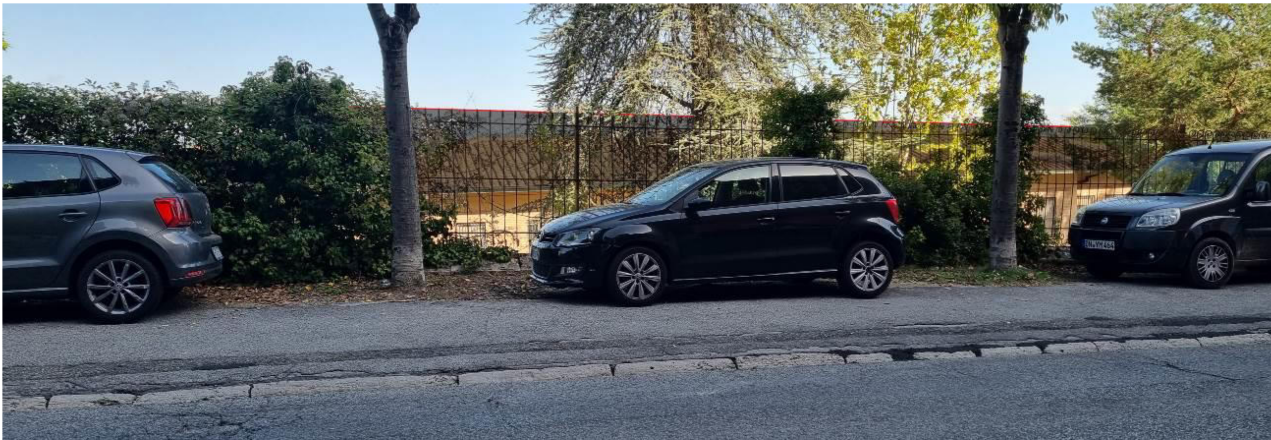
Vista da viale Don G. Minzoni, la linea rossa indica l'altezza di progetto , maggiore di circa cm.90 rispetto allo stato attuale. La visuale verso le colline non viene modificata