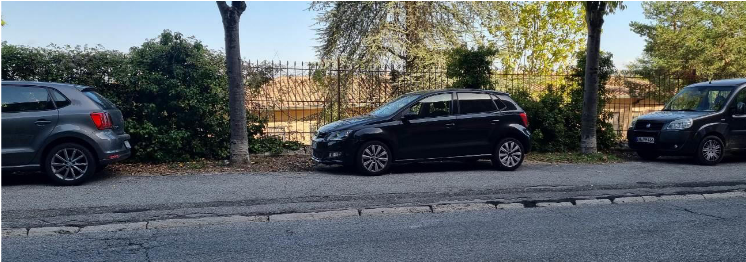
Vista da viale Don G. Minzoni dello stato attuale, il colmo della copertura nasconde la visuale delle colline circostanti