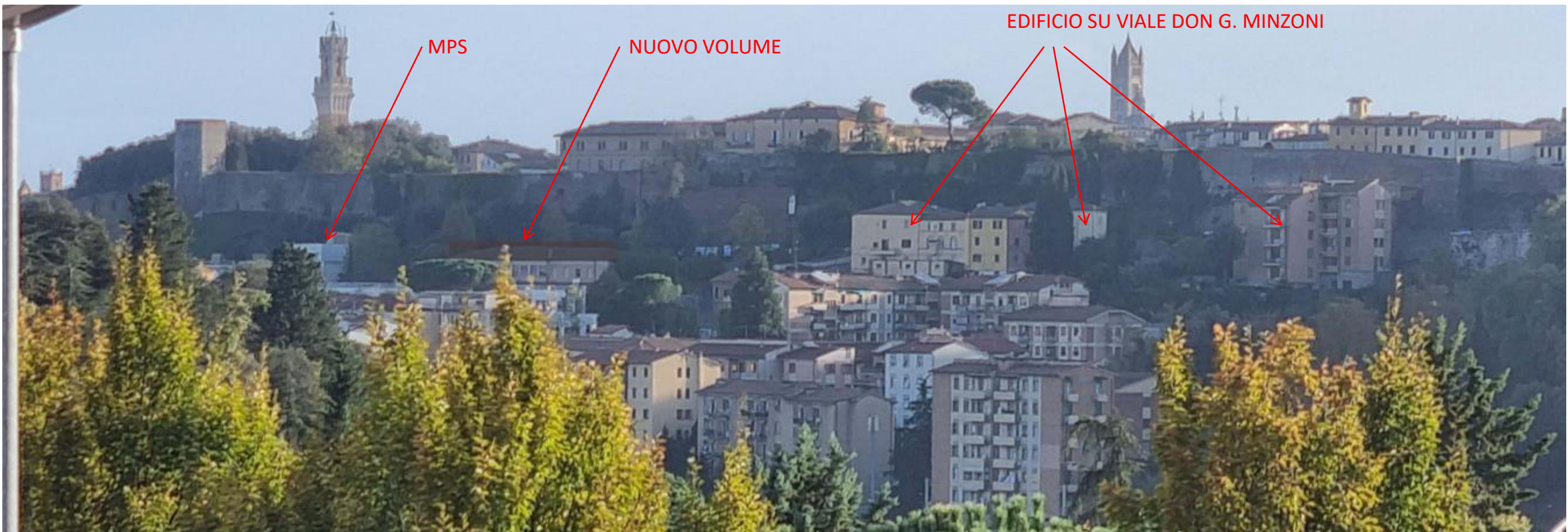
Vista da Scacciapensieri, il nuovo volume (linea rossa) rimane ad un'altezza inferiore degli edifici presenti su viale Don G. Minzoni