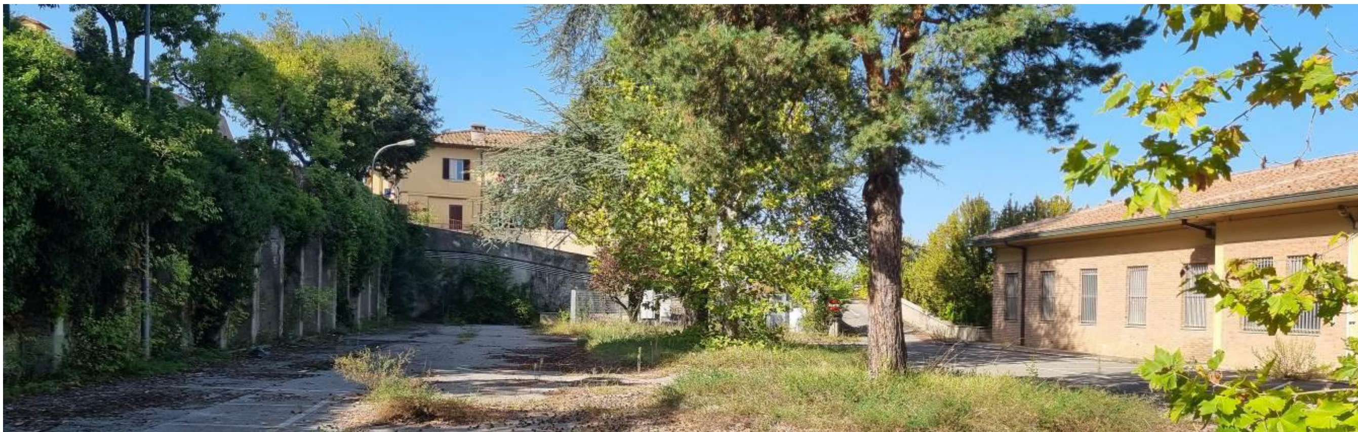
Stato attuale dall'interno del piazzale di proprietà, a sinistra il muro di contenimento di viale Don G. Minzoni.