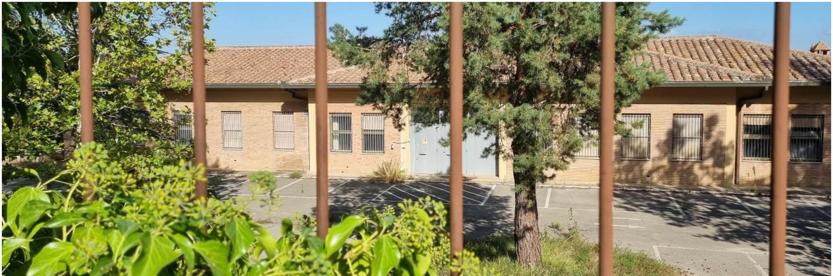
Vista da viale Don G. Minzoni dello stato attuale, il colmo della copertura nasconde la visuale delle colline circostanti