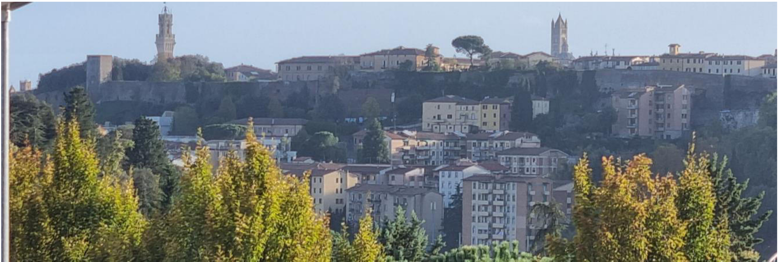
Vista da Scacciapensieri, stato attuale