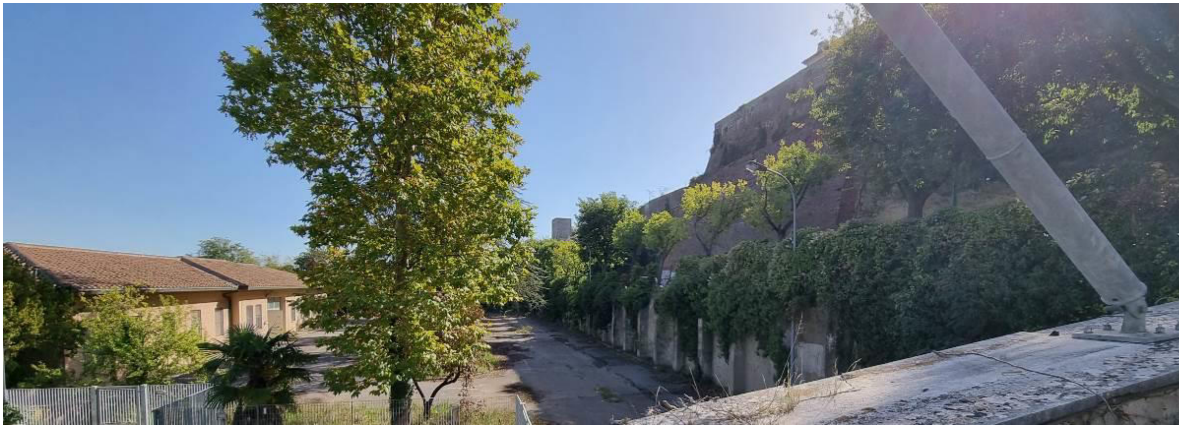
Stato attuale dall'interno del piazzale di proprietà, a destra il muro di contenimento di viale Don G. Minzoni.