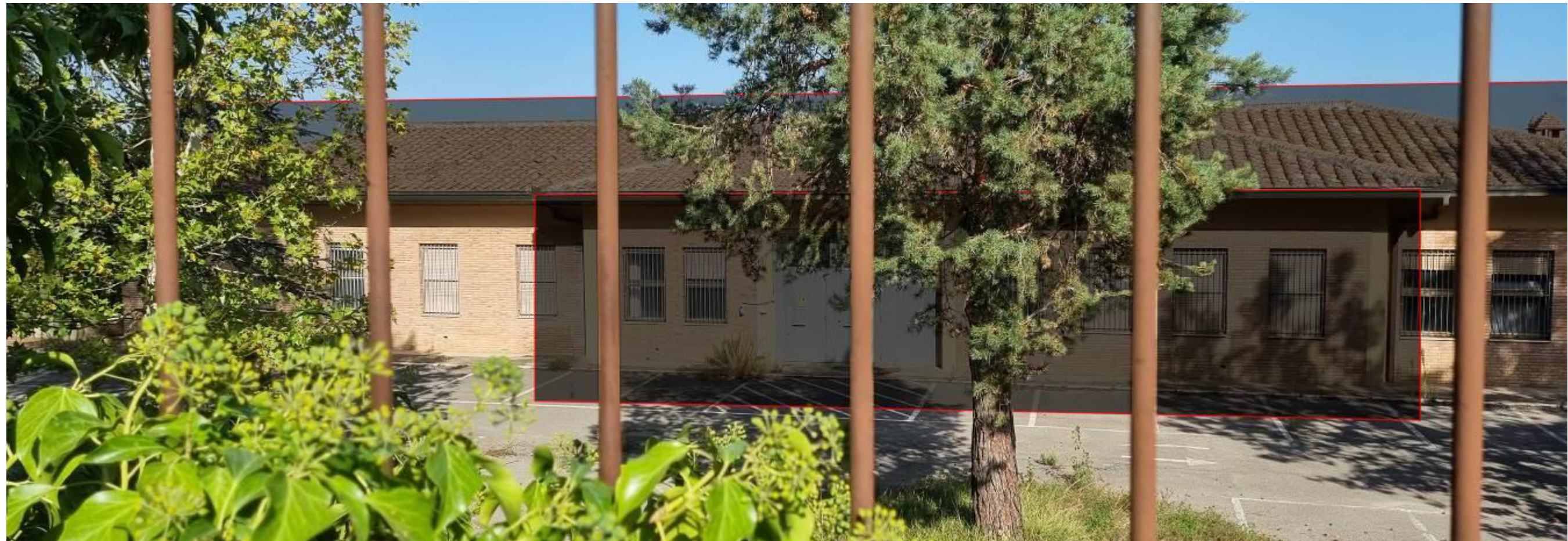
Vista da viale Don G. Minzoni, la linea rossa indica l'altezza di progetto, maggiore di circa cm.90 rispetto allo stato attuale. La visuale verso le colline non viene modificata