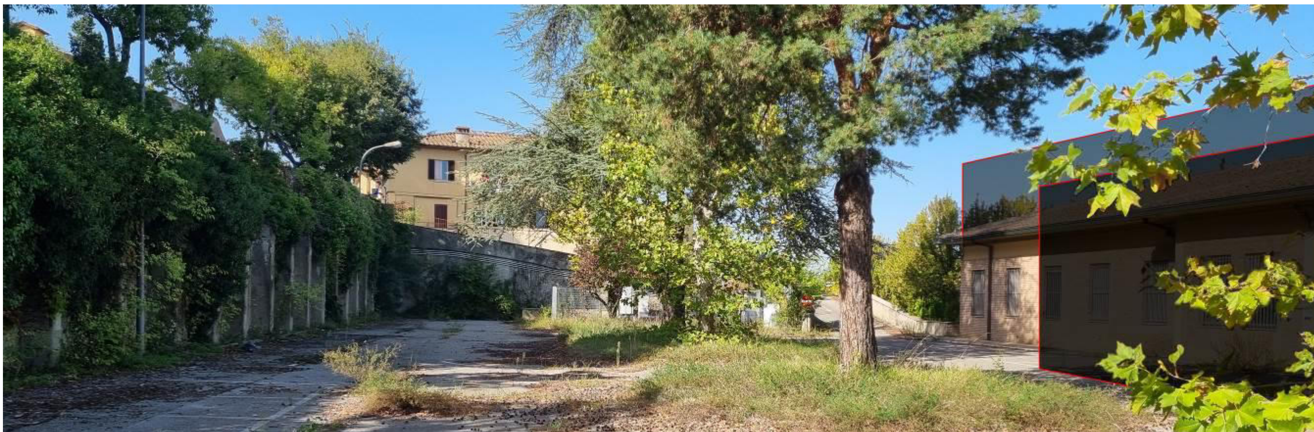
Vista dall'interno del piazzale di proprietà. I nuovi volumi (linea rossa) sono pressoché corrispondenti all'altezza del muro di contenimento di viale Don G. Minzoni.