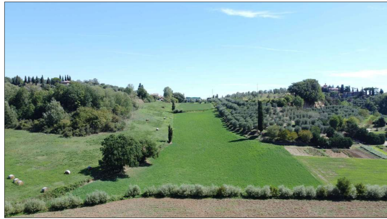
Ripresa fotografica 1